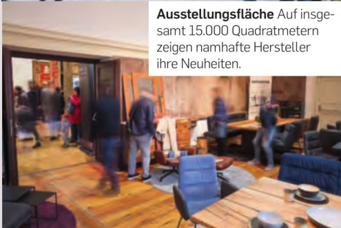
Ausstellungsfläche Auf insgesamt 15.000 Quadratmetern zeigen namhafte Hersteller ihre Neuheiten.

F rühlingshafte Temperaturen und eine herrschaftliche Kulisse sorgen für das passende Ambiente, wenn das Areal vor dem Schloss Grafenegg am ersten Maiwochenende wieder zum Festivalgelände für die Design Days wird. Rund 300 Marken gastieren bei der Living- und Lifestylemesse auf 15.000 Quadratmetern, darunter etwa Polestar, Bene, Domus und Cubic. Flankiert wird die Designmesse von einem musikalischen Rahmenprogramm – mit Livekonzerten im Wolkenturm von Josh. (»Cordula Grün«) und der Italo-Formation Pino Barone Band.