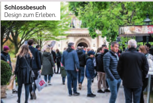
Schlossbesuch Design zum Erleben.

F rühlingshafte Temperaturen und eine herrschaftliche Kulisse sorgen für das passende Ambiente, wenn das Areal vor dem Schloss Grafenegg am ersten Maiwochenende wieder zum Festivalgelände für die Design Days wird. Rund 300 Marken gastieren bei der Living- und Lifestylemesse auf 15.000 Quadratmetern, darunter etwa Polestar, Bene, Domus und Cubic. Flankiert wird die Designmesse von einem musikalischen Rahmenprogramm – mit Livekonzerten im Wolkenturm von Josh. (»Cordula Grün«) und der Italo-Formation Pino Barone Band.