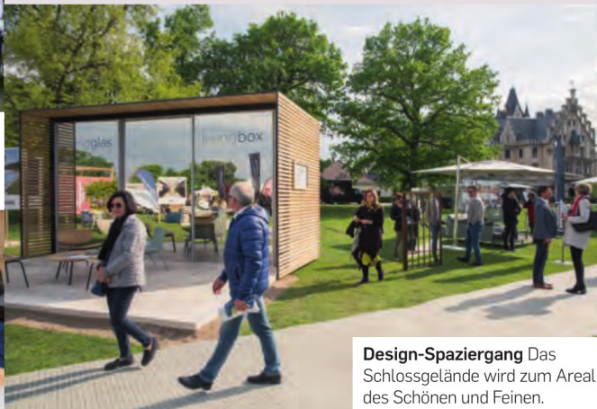
Design-Spaziergang Das Schlossgelände wird zum Areal des Schönen und Feinen.